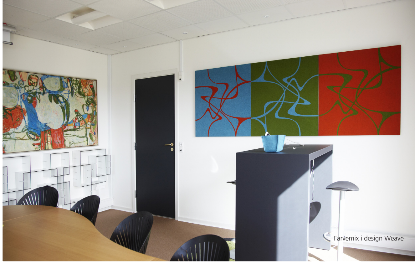
Farvemix i design Weave